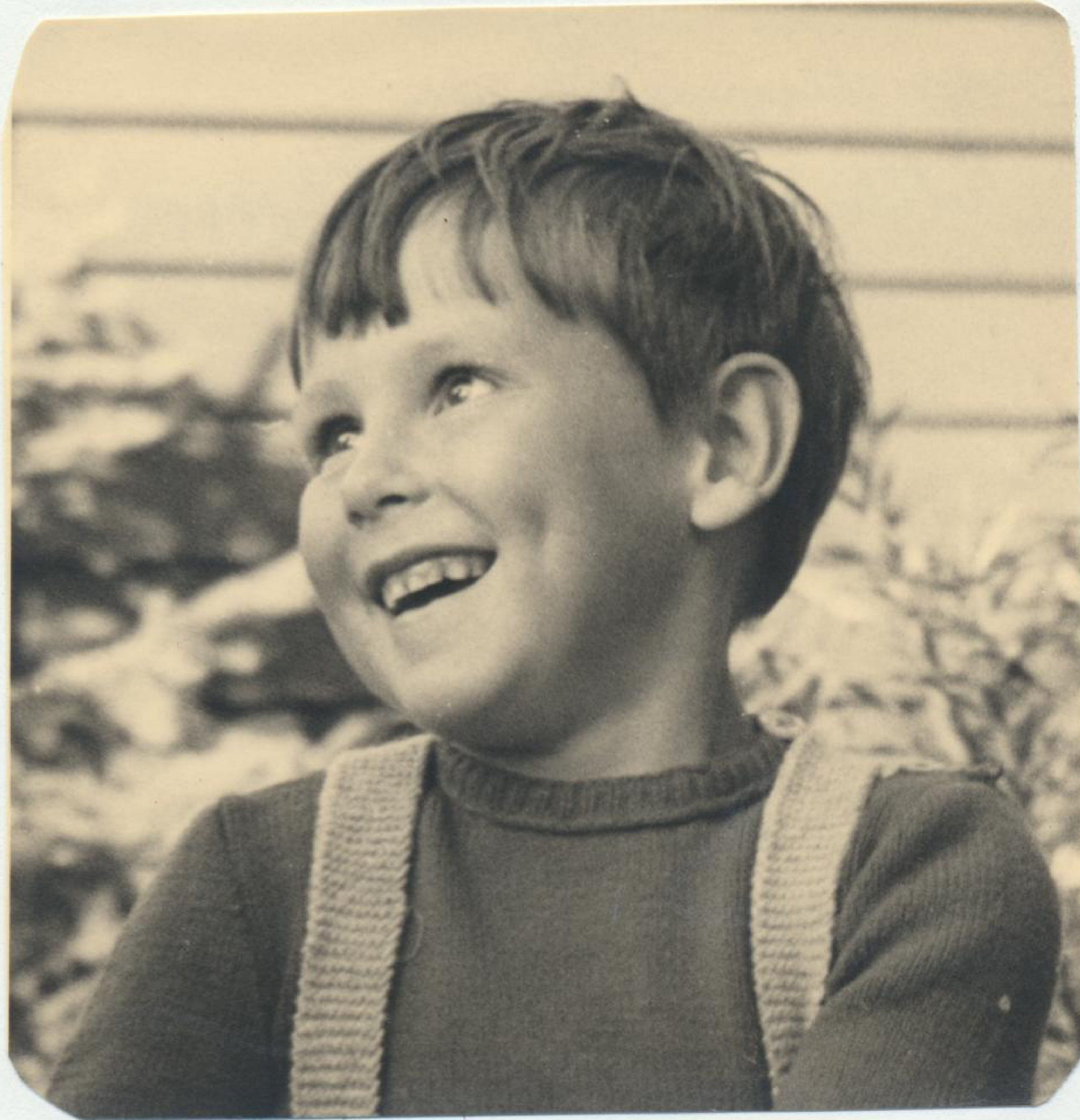
Mullbystrand aug 1949